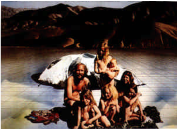
1971/73 / 5 STORIE DEL SUPERSTUDIO - VITA