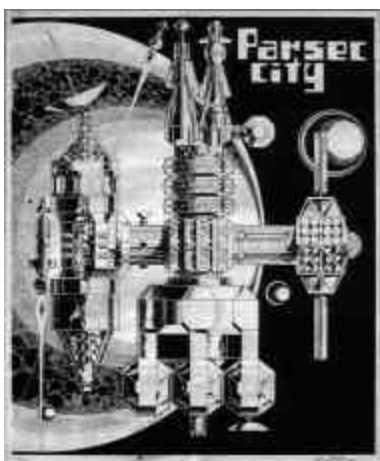
1970 / PARSEC CITY